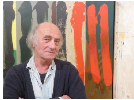
Oulchy-le-Château, septembre 2018