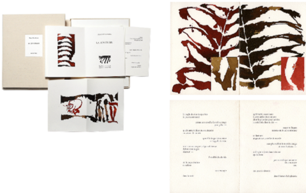
Livre Illustré Gérard Titus-Carmel, La Jonchaie , Rencontres, 2006