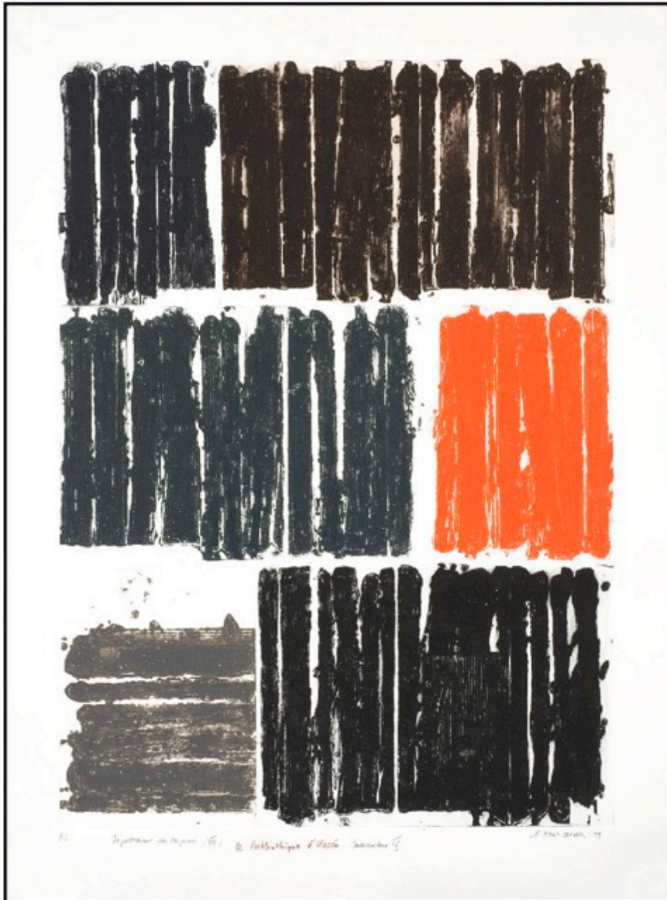
La Bibliothèque d'Urée – Carborundum IV, 2009, (photo Michel Minetto)