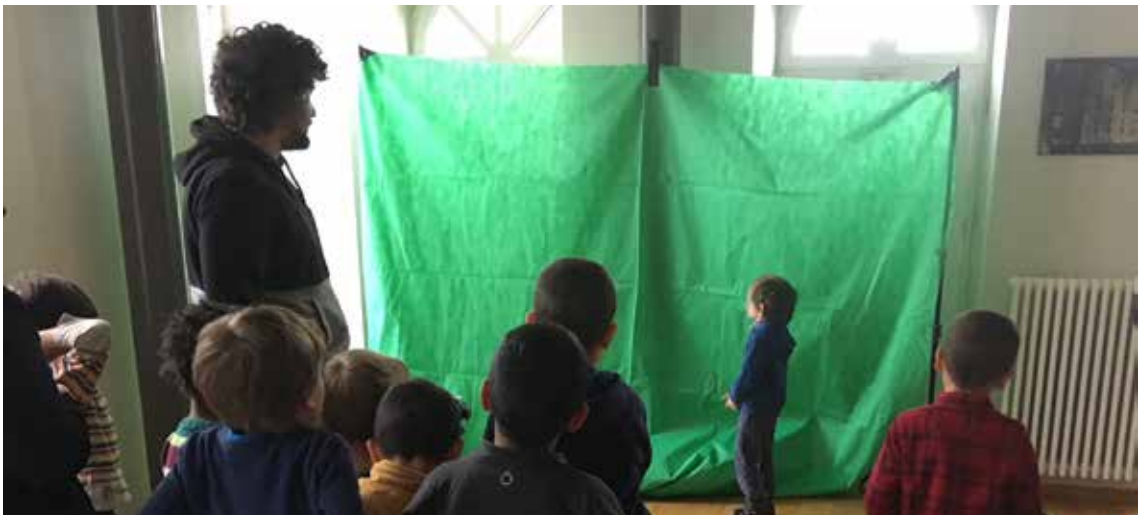
Atelier « fond vert » animé par CUMAMOVI