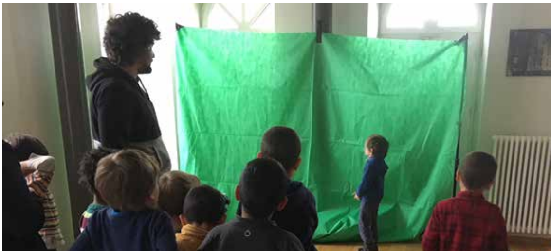
Atelier « fond vert » animé par CUMAMOVI