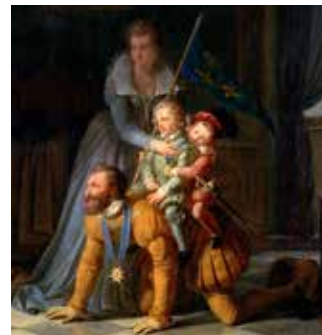
Figure incontournable du château, Henri IV est au cœur de l'histoire du monument et de son domaine. La prestige de ce roi, bercé enfant dans une carapace de tortue précieusement conservée, donne au château qui le vit naître, une renommée unique. Les animations proposées ici s'articulent autour de la figure du roi sous différents aspects.