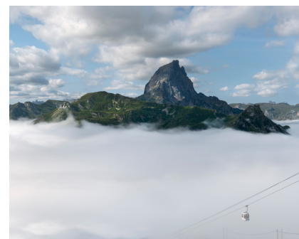
Didier Sorbé, Pic du Midi d'Ossau