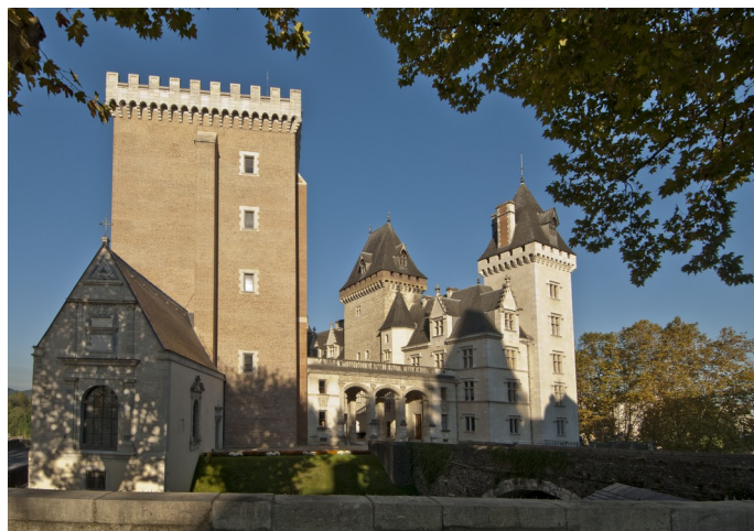
Vue de l'aile est du château de Pau

Situé au cœur du grand sud-ouest, entre Bordeaux et Toulouse, à proximité de l'Espagne, ce palais successivement seigneurial, royal, impérial, est aujourd'hui un musée national qui accueille chaque année plus de 100 000 visiteurs. Sa longue et riche histoire peut encore se lire dans son étonnante architecture, où se mêlent éléments médiévaux, Renaissance et romantiques. De ce passé stratifié, le château a conservé ses trois ailes assemblées en triangle autour d'une majestueuse cour d'honneur ainsi qu'un domaine de plus de 22 hectares de jardins et de parc forestier, vestige du magnifique ensemble constitué par les Albret au XVI e siècle.