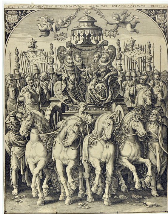
Pierre Firens, Char triomphal célébrant les mariages royaux de 1615