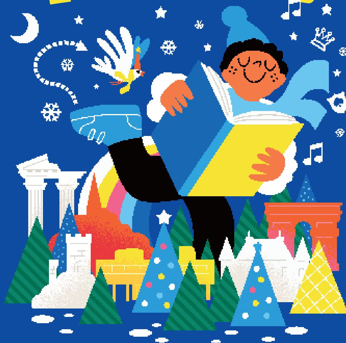
Illustration : Clod - Design graphique : Philafer